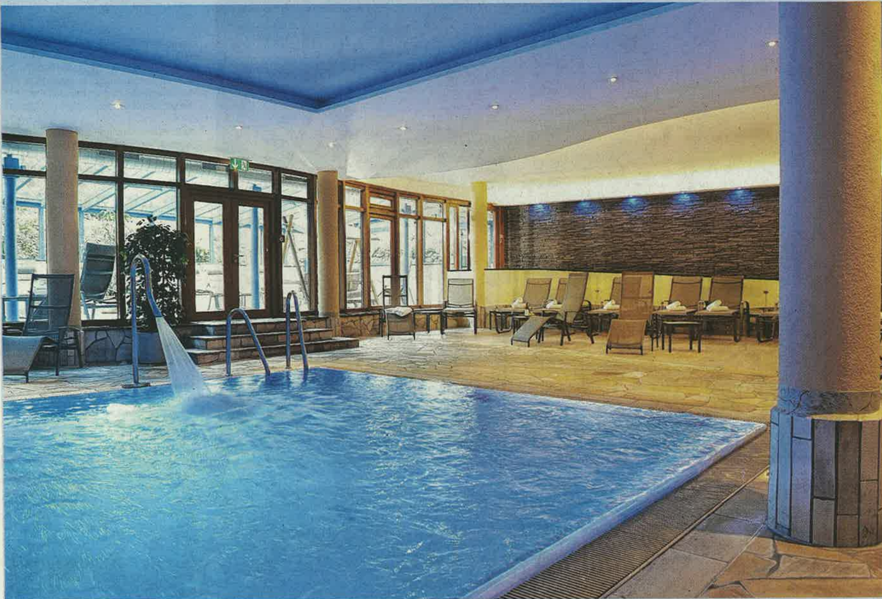
Im Vitus Spa Wellnessbereich können die Gäste sportlich aktiv werden oder auch einfach nur abschalten und den oftmals hektischen Alltag hinter sich lassen.