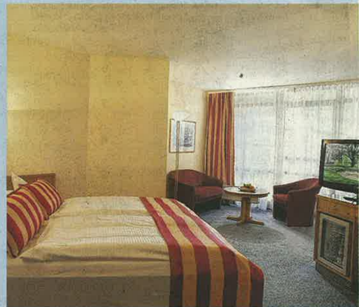
Zur Ruhe kommen: Die Suiten des Kurhotels lassen Körper und Seele wieder neue Kraft tanken.

Das wird am 6. September genauso sein. Die Besucher erwartet ein bunter Mix aus Information, Kurzweil und kulinarischem Genuss. 25 Jahre jung – das „Best Western Plus Kurhotel an der Obermaintherme“ in Bad Staffelstein freut sich auf ein sicher schönes Jubiläumfest beim Tag der offenen Tür. Mario Deller