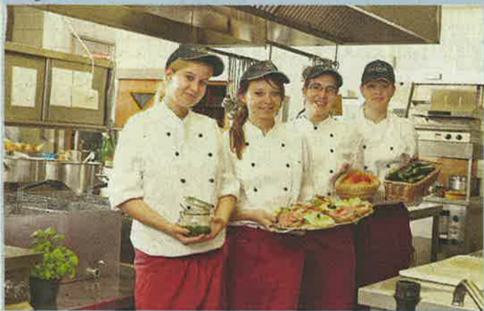
Frische Zutaten und engagiertes Team: Das Küchenpersonal des Hauses sorgt für das kulinarische Wohlergehen der Gäste.

E-Mail: info@eichhorn-autozubehoer.de Bamberger Straße 92 · 96215 Lichtenfels Telefon 09571/9539-0 · Fax 09571/953939