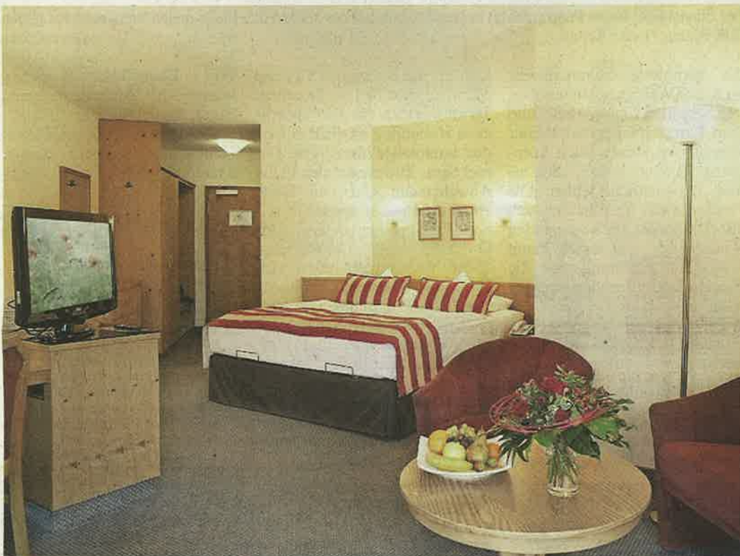
Zur Ruhe kommen: Die Junior Suiten des Kurhotels lassen Körper und Seele wieder neue Kraft tanken.

Langeweile wird auch für die kleinen Besucher beim Jubiläumsfest des Kurhotels ein