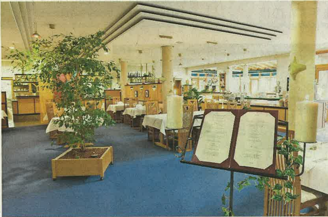
Stilvoll und gemütlich zugleich gestalten sich die gastronomischen Räumlichkeiten des Kurhotels an der Obermaintherme.